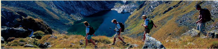
Les hôteliers valaisans pourront continuer à proposer des promenades à leurs clients.

raquettes sans autres restrictions que celles du bon sens. Avantage du modèle choisi par le Parlement: les références sont nettes. Elles sont définies par une