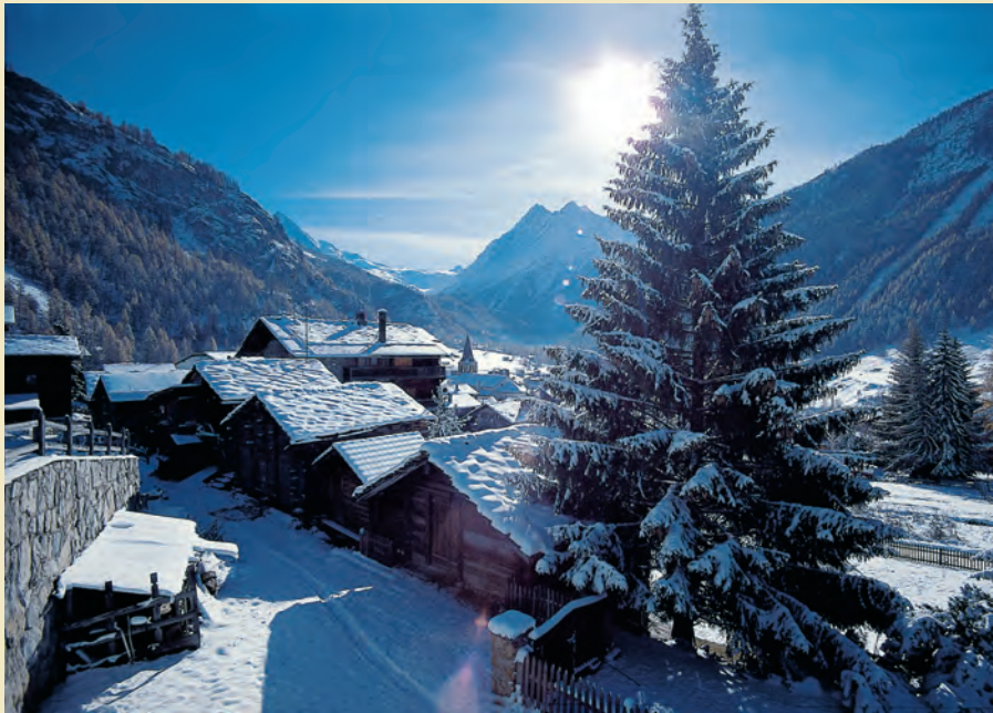
L'hôtellerie de montagne a des contraintes et des besoins particuliers.

Une table ronde consacrée aux "enjeux futurs de l'hôtellerie de montagne" s'est tenue le 10 octobre dernier à Zermatt. Ces discussions se sont déroulées sous l'égide de l'UBS.